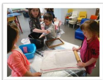
Atelier de fabrication de papier recyclé

Activité pour découvrir comment est fabriqué et recyclé le verre avec un atelier créatif.