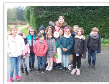
Ramassage de déchets