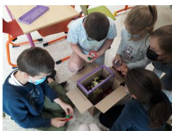
Observation des petites bêtes

Cette activité peut accompagner la mise en place d'un jardin à l'école ou d'un composteur.